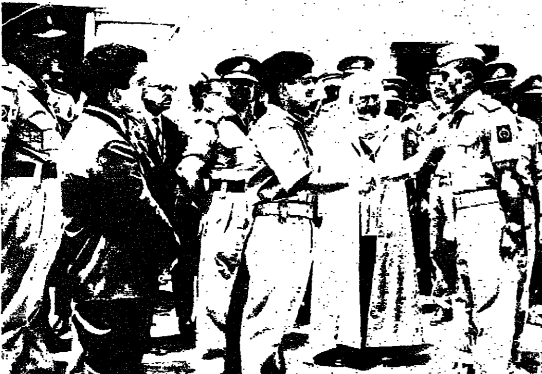
جلالة الملك يصافح احد المرشحين الخريجين من المدرسة العسكرية في عمان والقائد عمار حاش رئيس هيئة الاركان

كلمة مندوب فرنسا ورفض المندوب كود تشييه مندوب فرنسا ادعاء اسراييل بان الفلابة الجوية يوم الاحد الماضي على قاعدة مزعومة للقوات الجوية قرب المسط البيجة على الصفحة السادسة عمود ٧